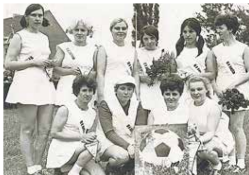
1. Frauenfußballmannschaft des Kombines MS Rohfilm, 1971

Die werkseigene Sportgemeinschaft BSG Chemie Wolfen gehörte zum größten Freizeitanbieter. Sie war eine der zahlenmäßig größten Betriebssportgemeinschaften im damaligen Bezirk Halle. In 16 Sektionen waren über 2100