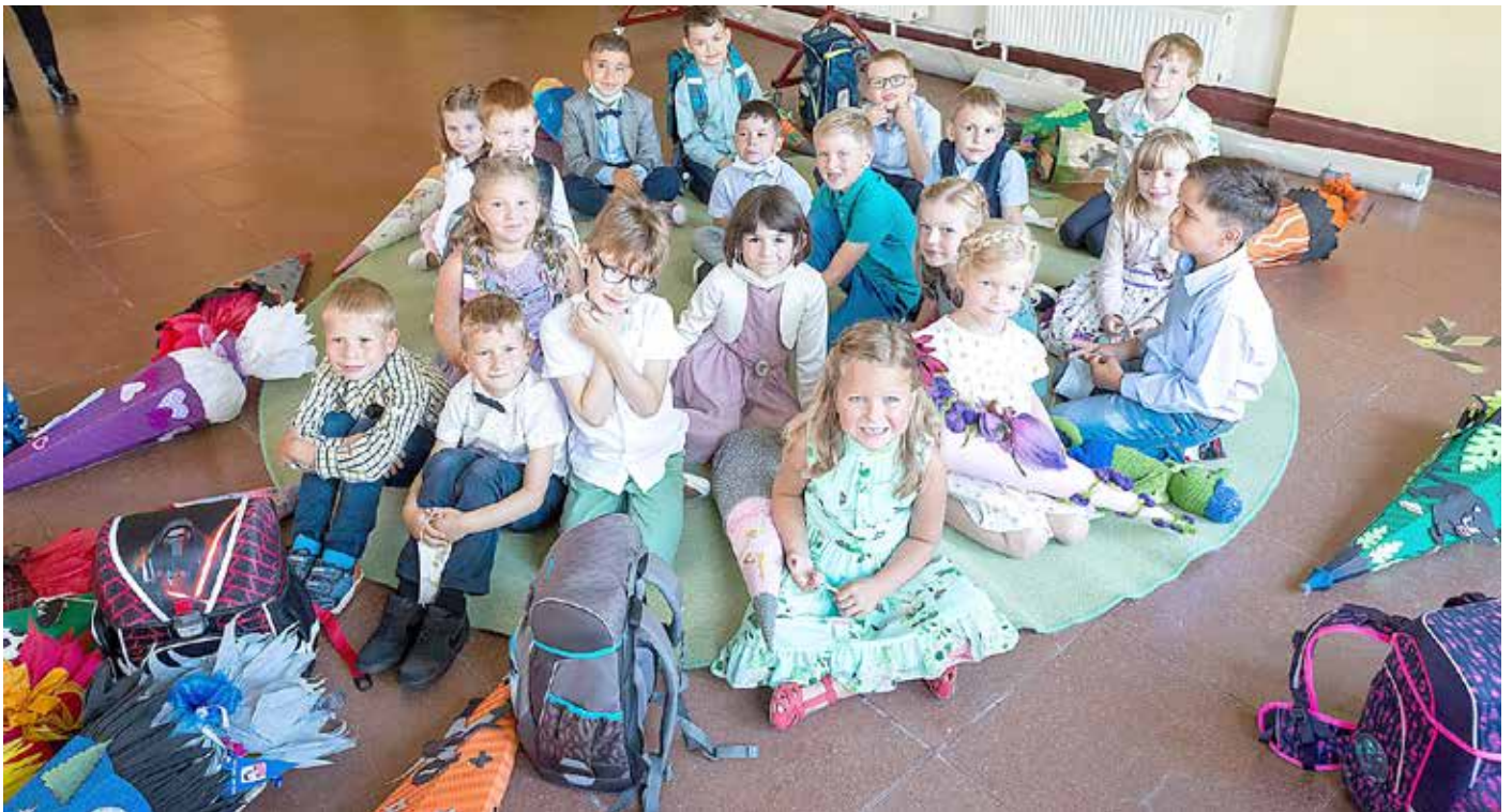
Einschulungsfoto der Ev. Grundschule in Wolfen

Der Diakonieverein e.V. Bitterfeld-Wolfen-Gräfenhainichen wurde am 06.04.1991 als gemeinnütziger Träger evangelischer Sozialarbeit mit Sitz in Wolfen gegründet. Die mehr als 320 Mitarbeiter verteilen sich auf den Verein und die Tochtergesellschaften DIAKONIE Soziale Dienste gGmbH und DIAKONIE ERZIEHUNG UND BILDUNG gGmbH. Neben einer anerkannten Werkstatt für Menschen mit Behinderungen an den Standorten Wolfen und Gräfenhainichen mit insgesamt knapp 500 Beschäftigten, gehören auch verschiedene Wohnangebote für Menschen mit Behinderungen oder Senioren, ambulante Pflegedienste, Familienberatung/-unterstützung, Jugend- und Familienhilfe sowie eine Evangelische Grund- und eine Gemeinschaftsschule sowie ein Evangelischer Kindergarten dazu.