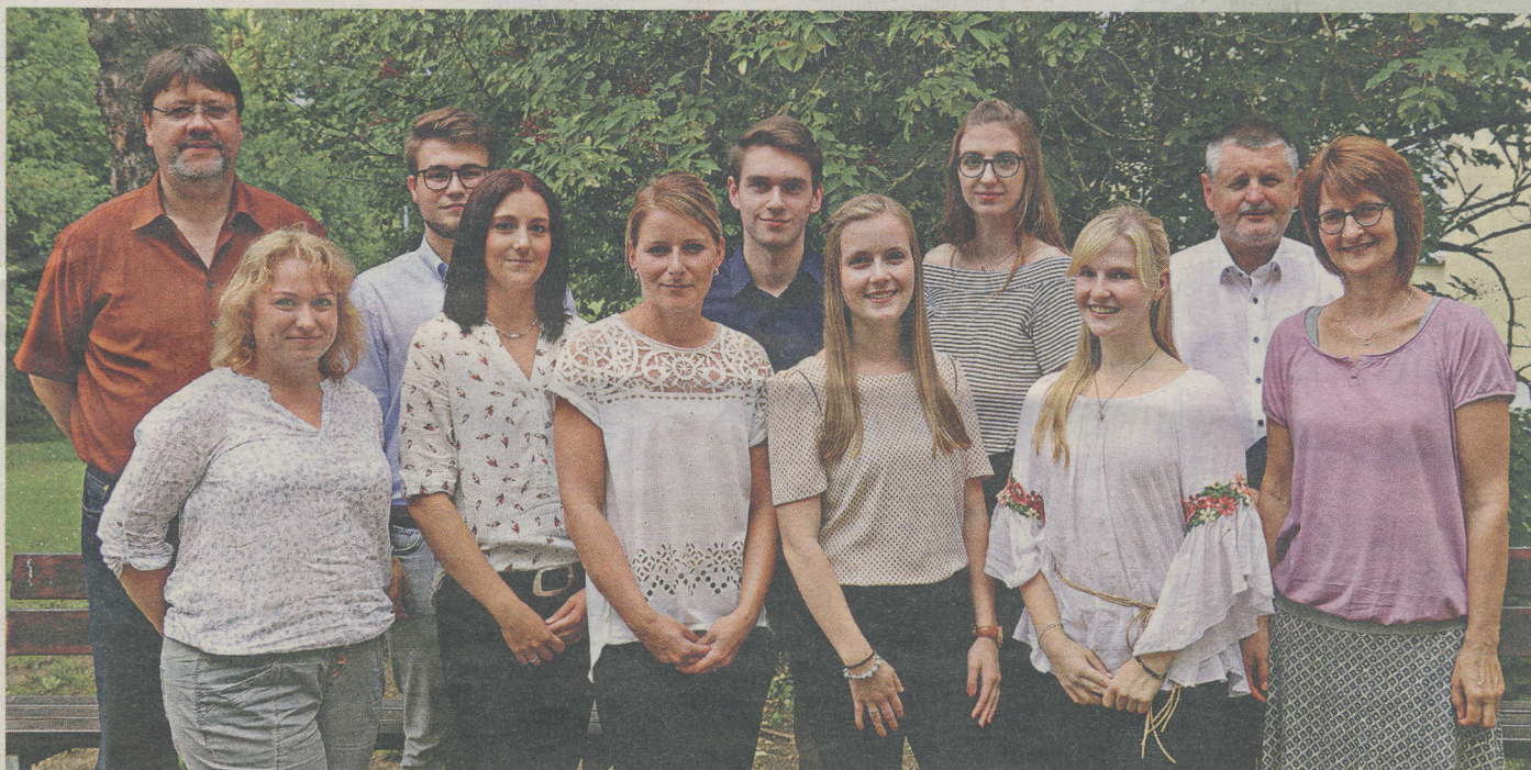
Die neuen Azubis 2017.

Interessenten für das Einstellungsjahr 2018 können sich bis zum 3.11.2017 bewerben.