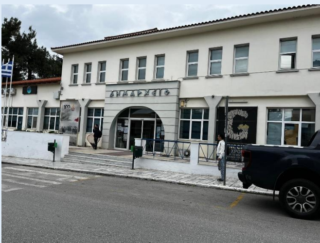
Rathaus der Gemeindeverwaltung Oreokastro

Unser Flug mit Ryanair brachte uns dann in nur 2,5 Stunden nach Thessaloniki, der zweitgrößten Stadt Griechenlands. Dort wurden wir von einem Vertreter der Gemeinde Oreokastro empfangen und in ein zentral gelegenes Hotel gebracht. Am nächsten Tag besuchten wir das Rathaus der Stadtverwaltung, wo wir unsere Arbeitsplätze im Großraumbüro zugeteilt bekamen. Dabei fiel uns auf, dass die Verwaltung im Vergleich zu deutschen Standards über viel weniger Personal verfügt.