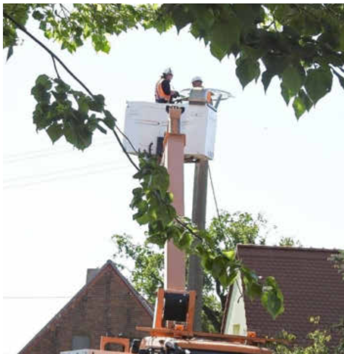
Montage der Nisthilfe am 02.05.2024 durch eine beauftragte Firma der MITNETZ Strom, Anlagenmanagement Köthen.

Die hierzu benötigte Technik für die Montage organisierte die MITNETZ Strom in Köthen. Während der Montage be-