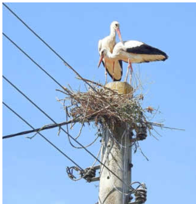
Die Situation vor Ort am 27. April. Das von den Störchen auf dem Betonmast aufgelegte Nistmaterial liegt in der Leitung.

Hoffen wir, dass ab Anfang Juni, nach ca. 33 Tagen Brutzeit, die Jungstörche ihre Schnäbel über den Horstrand strecken und die Eltern ihren Nachwuchs bis zum Abflug in das afrikanische Winterquartier Ende August fleißig mit Futter aus den unmittelbar angrenzenden Fuhnewiesen versorgen.