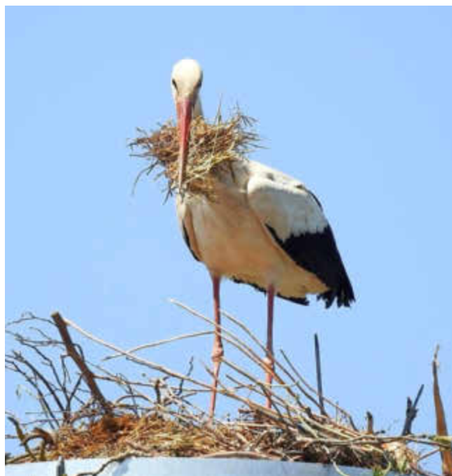
Letzte Arbeiten am neuen Horst!