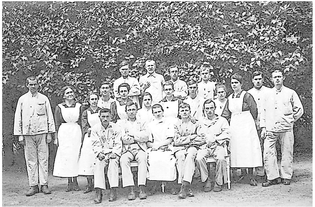
Belegschaft um 1929

Im Goitzsche Klinikum in Bitterfeld ist derzeit eine Fotoausstellung zu sehen, die spannende Einblicke in die Geschichte des Krankenhauses bietet. Insgesamt zwölf großformatige historische Aufnahmen führen in das Jahr 1929, als das noch heute genutzte Klinikareal in der Friedrich-Ludwig-Jahn-Straße eingeweiht wurde. Zu sehen ist unter anderem eine Luftaufnahme von dem ursprünglichen Komplex, von dem heute noch das markante Torhaus sowie die Seitenflügel erhalten sind. Der Mittelbau mit Empfangshalle und OP-Trakt wurde hingegen im Zuge des Klinikausbaus nach dem Jahrhunderthochwasser 2003 abgerissen.