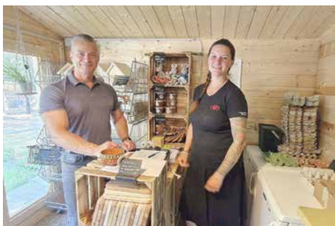
Der Hofladen des Tiergeheges in Reuden