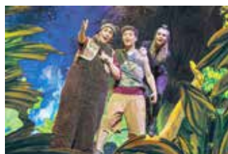
Dschungelbuch - das Musical

Kinder und Familien können in der neuen Saison gleich aus mehreren großen Shows wählen oder einfach alle besuchen. Zum zweiten Mal sind Mädchen und Jungen nebst Eltern zum großen „SchlossGrusel“ eingeladen. Am 30. Oktober gibt es im Schloss Köthen viele gruselige Angebote, die am Abend in einem Konzert mit der Band „Rumpelstil“ münden. „Das Dschungelbuch“ wird am 17. Januar im Familienmusical aufgeblättert, mit „Hakuna Matata“ ist am 26. Januar eine Kindermusical-Gala zu erleben. Ganz besonders verspricht das Konzert von „Heavysaurus“ zu werden, wenn man