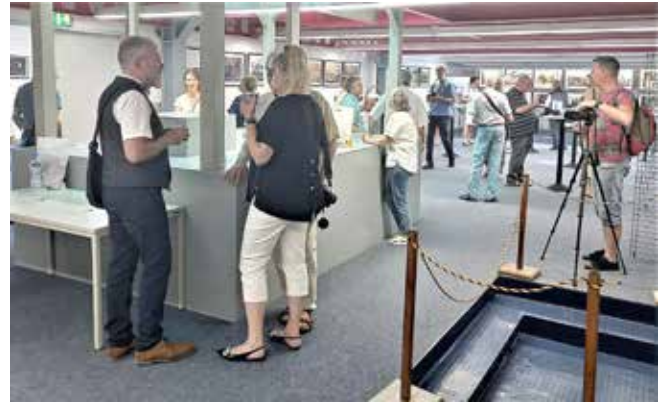
Zahlreiche Gäste nahmen an der Ausstellungseröffnung am 10. August 2024 im IFM teil und erfuhren einiges über das künstlerische Spätwerk von Mieczysław Wielomski.

Die Fotoschau ist bis zum 15. September, täglich (außer montags) von 10:00 bis 16:00 Uhr im Industrie- und Film-museum Wolfen zu sehen.