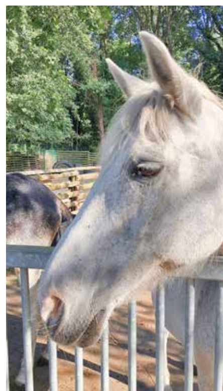
Zahlreiche Tiere leben im Tiergehege Reuden und freuen sich über Besucher