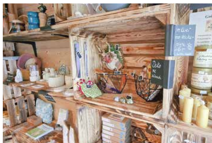
Viele regionale Spezialitäten werden den Gästen angeboten