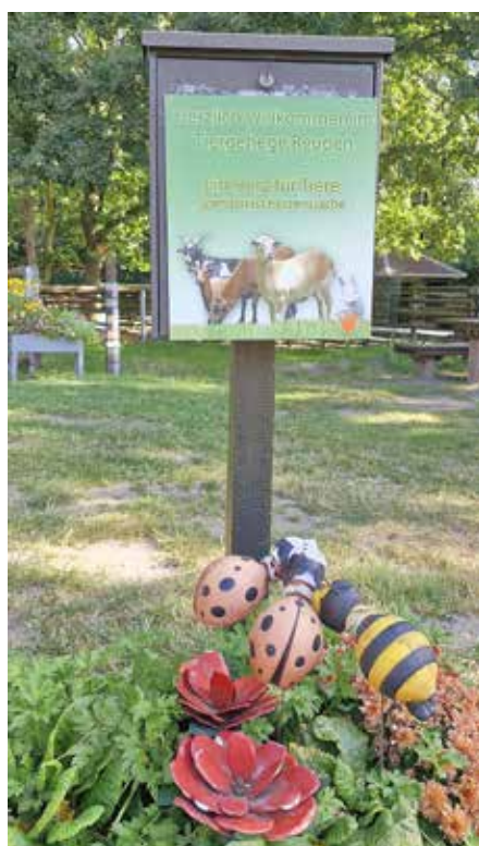
Herzlich Willkommen im Tiergehege Reuden