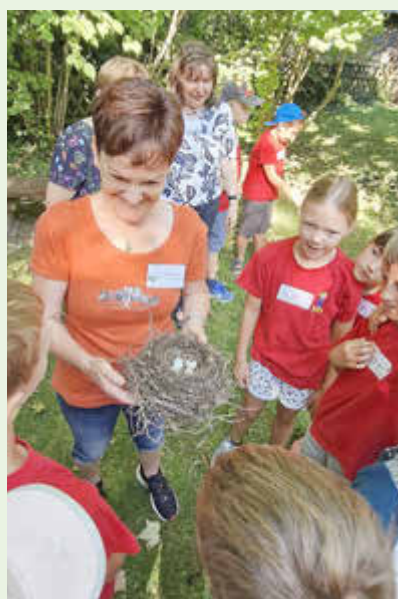
Am Projekttag gaben Naturfreunde ein Amselnest als Anschauungsobjekt ab.

An diesem Tag besuchte die 3. Klasse der Grundschule Delitzsch-Ost das Informationszentrum in Schlaitz. Die 17 Schülerinnen und Schüler erwartete eine besondere Überraschung, denn unter ihnen befand sich das 40.000. Teilnehmerkind seit Beginn des Umweltbildungsprojektes: Sie erhielten einen symbolischen Scheck von enviaM und MITGAS über 40.000 Cent für ein Schulgartenprojekt.