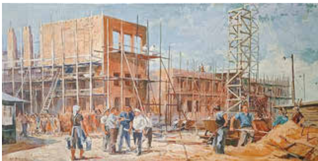
Walter Dötsch, Neubau des Kulturpalastes, 1957

13. Oktober 2024, 16 Uhr: Vernissage zur Ausstellung „Kunst für alle! 70 Jahre Kulturpalast Bitterfeld und das betriebliche Volkskunstschaffen“