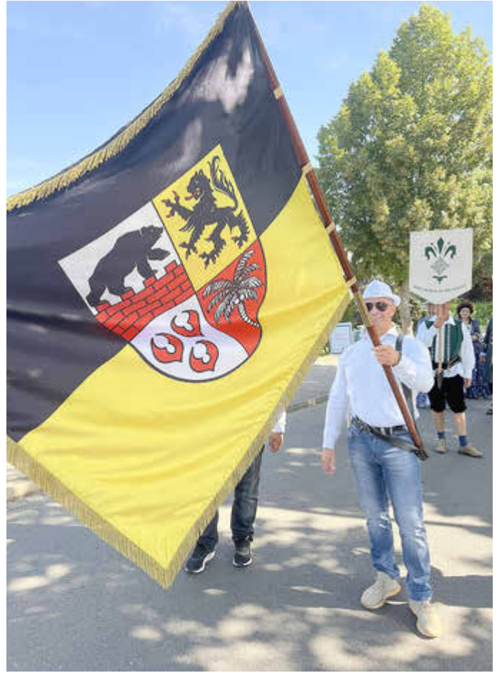
Der Landrat an der Spitze der Landkreispräsentation zum Festumzug.