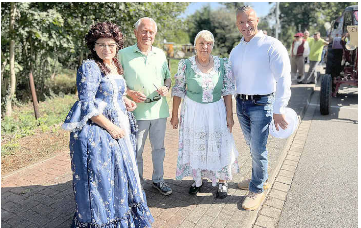
Landrat Andy Grabner (r.) zusammen mit dem Förderverein Irrgarten Altjeßnitz e.V. beim Festumzug am 01. September 2024 in Stendal

Informations- und Amtsblatt des Landkreises Anhalt-Bitterfeld