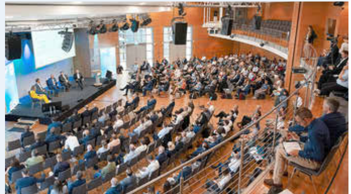
4. Mitteldeutscher Wasserstoffkongress in Erfurt

Der Landkreis Anhalt-Bitterfeld dankt der Europäischen Metropolregion Mitteldeutschland und dem HYPOS e.V. nochmals recht herzlich für die Einladung zum 4. Mitteldeutschen Wasserstoffkongress und freut sich auf die weitere Zusammenarbeit sowie die gemeinsamen Vorhaben.