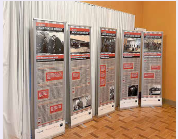
Die Ausstellung „60 Jahre 'Nackt unter Wölfen'“ war u.a. bereits in Berlin, Weimar, Jena, Nordhausen, Gotha, Erfurt und Rostock zu sehen.

Die Ausstellung im IFM ist täglich, außer montags, von 10:00 bis 16:00 Uhr zu besichtigen.