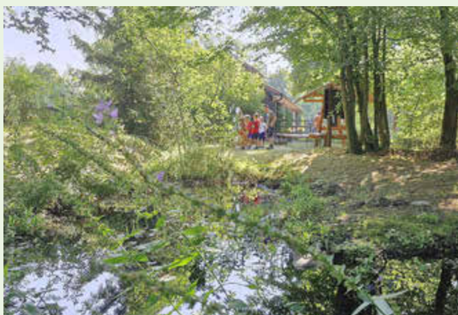
Der Garten des HAUS AM SEE

Die Schüler entdeckten die heimischen Tiere der Region z.B. Igel und Ringelnatter, lernten vieles über das Ökosystem Wald als Lebensgemeinschaft, testeten ihr Wissen über die Unterschiede zwischen Laub- und Nadelbäumen und nahmen positive Erinnerungen über Wildtiere und Spurensuche mit nach Hause.