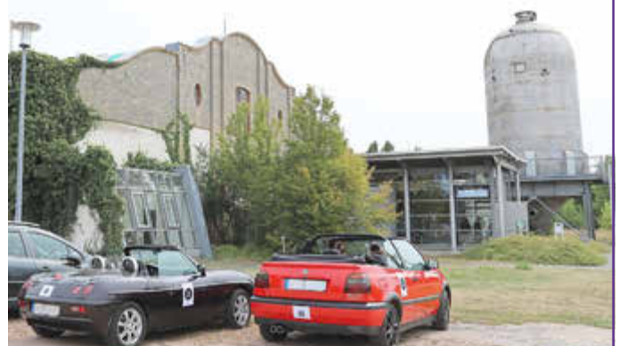
Ladies Cabrio Rallye 2024

Auf einer Strecke von ca. 100 km steht bei der alljährlich stattfindenden Rallye der Spaß im Vordergrund. An verschiedenen anzufahrenden Stationen stehen dabei Aufgaben bereit, die mit Köpfchen, Geschick und Humor zu meistern sind. Eine der Stationen war in diesem Jahr das Industrie- und Filmmuseum Wolfen. Die 18 Teams, aus jeweils zwei Teampartnerinnen, bekamen Aufgaben für die Bereiche Faser, Industrie und Filmherstellung, die sie alle mit viel Interesse, Spaß und Bravour bewältigten.