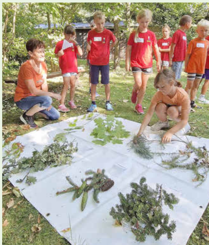
Die Kinder testen ihr Wissen über die heimischen Laub- und Nadelbäume.

Im Jahr 2010 initiierte MITGAS das Umweltbildungsprojekt „Natur zum Anfassen“. Gestartet mit 300 Grundschulern, veranlassten die positive Resonanz und Nachfrage MITGAS und enviaM, das Projekt nicht nur weiterzuführen, sondern darüber hinaus regional zu erweitern. Zwischen 2010 und 2023 haben insgesamt mehr als 39.000 Kinder an „Natur zum Anfassen“ teilgenommen. Im nunmehr 15. Projektjahr stehen den Schülerinnen und Schülern insgesamt 15 Naturschutzstationen in Sachsen, Sachsen-Anhalt und Brandenburg für kostenfreie Exkursionstage zur Verfügung. Angeboten werden die Exkursionstage, abhängig vom Leistungsumfang der jeweiligen Naturschutzstation, für Schulklassen der 2. bis 6. Klasse sowie Förderschulklassen. Während der Schulexkursion auf einen Naturhof erfahren die Schülerinnen und Schüler außerhalb des Klassenzimmers Lehrreiches über Pflanzen und Tiere. Durch praktische Erfahrungen vor Ort soll das Grundverständnis der Schülerinnen und Schüler für die Natur und den Umweltschutz gefördert werden. Im Vordergrund steht das gemeinsame Naturerlebnis im Klassenverband.