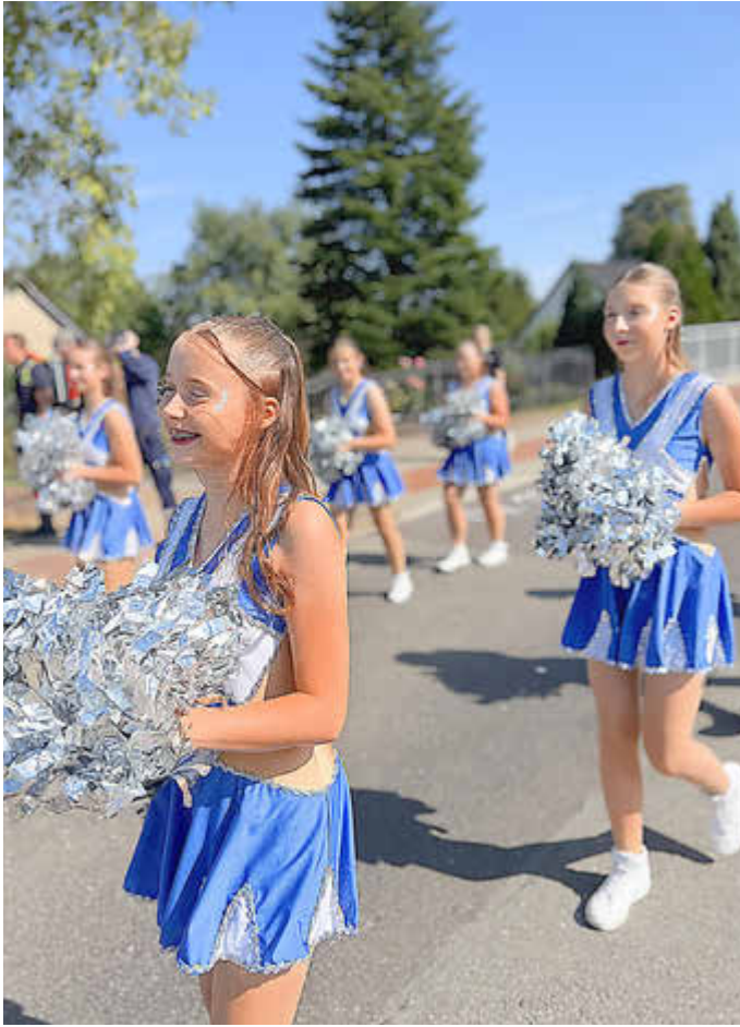
Die Cheerleader des KUKAKÖ e. V. machten Stimmung beim Festumzug