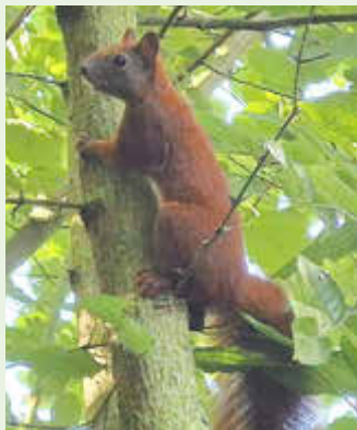
Eichhörnchen „Franz“ beobachtet die Besucher.

Der diesjährige Themenschwerpunkt lautet „Wilder Wald – wo sich Fuchs und Hase ‚Gute Nacht‘ sagen“ . Auch das HAUS AM SEE war am 29. August 2024 bereits zum zehnten Mal dabei und freute sich sehr darüber, den Kindern zu Beginn des neuen Schuljahres einen spannenden, lehrreichen und erlebnisreichen Tag in der Natur zu bieten.