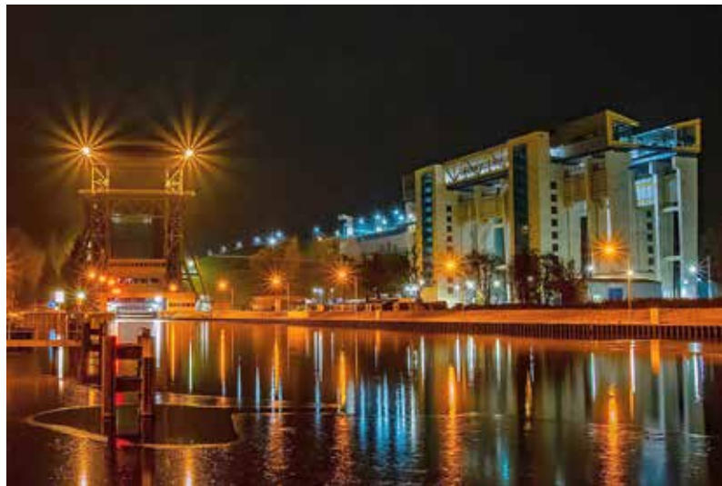
Den Sonderpreis des Industrie- und Filmmuseums erhielt das Foto: „Altes und neues Schiffshebewerk Niederfinow“

auch die, wo Menschen im Fokus (oder: Mittelpunkt) stehen. Der zur Ausstellung erschienene Katalog, der alle "100 Bilder des Jahres 2022" vorstellt, gibt Anregungen zu dieser Thematik. Der Katalog hat einen Umfang von 88 Seiten; ist vierfarbig und für 10,- Euro direkt in der Ausstellung und über die GfF erhältlich. Das Industrie- und Filmmuseum Wolfen stiftete traditionsgemäß auch 2022 einen IFM-Sonderpreis. Der ging an Steffen Wulkow aus Eberswalde für sein